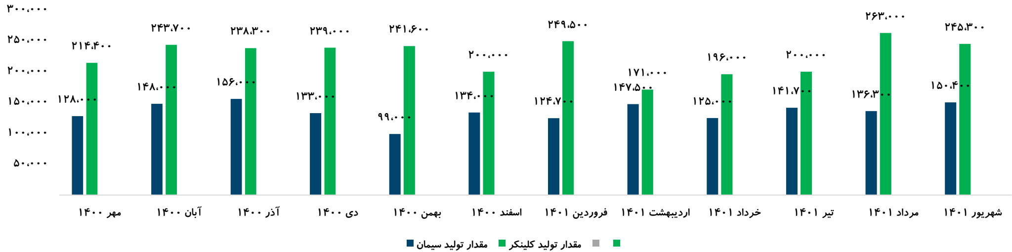
مبلغ کل فروش